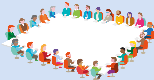
Comhairle CNCM NCCA Council