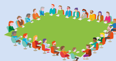
Bord don tSraith Shóisearach Board for Junior Cycle