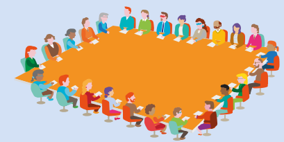
Bord don tSraith Shinsearach Board for Senior Cycle