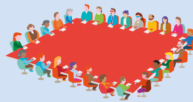
Bord don Luath-óige agus don MBunscoil Board for Early Childhood and Primary