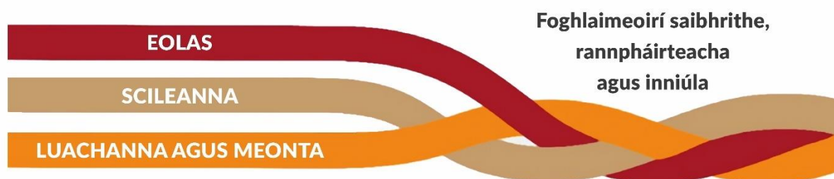
Fíor 1 Comhpháirteanna na bpríomhinniúlachtaí agus an tionchar a mianaítear leo

Is scáth-théarma é Príomhinniúlachtaí 2 ina ndéantar tagairt don eolas, na scileanna, na luachanna agus na meonta a fhorbraíonn an scoláire ar bhealach imeasctha le linn na sraithe sinsearaí.