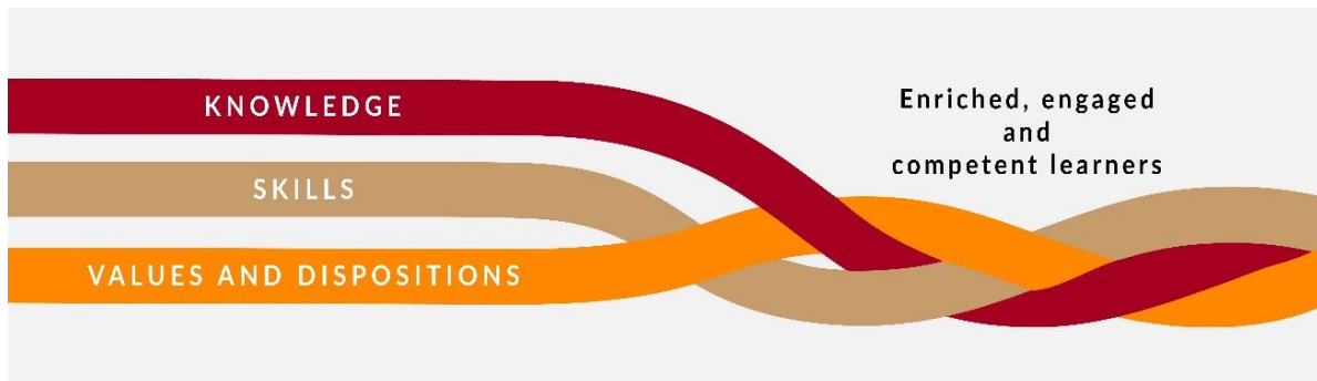
Fíor 1 Comhpháirteanna na bpríomhinniúlachtaí agus an tionchar a mhianaítear leo

Cabhraíonn an tsraith shinsearach leis an scoláire a bheith níos rannpháirtí, níos saibhrithe agus níos inniúla, agus é ag déanamh tuilleadh forbartha ar a chuid eolais, scileanna, luachanna agus meonta ar bhealach comhtháite.