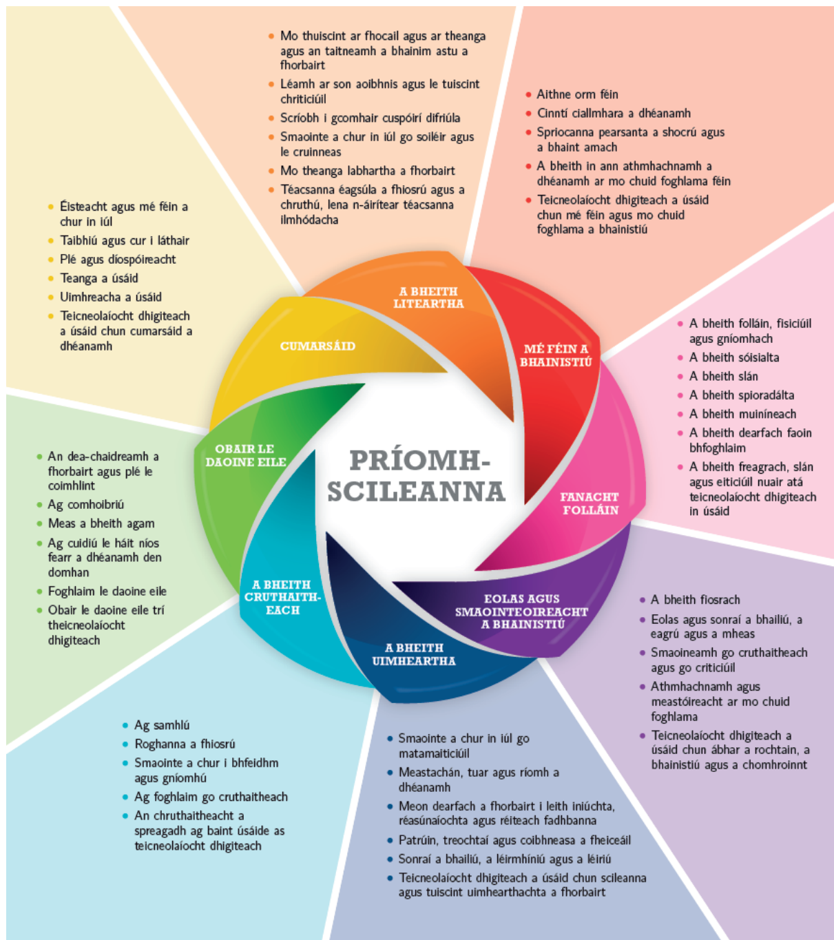
Fíor 1 : Ocht bpríomhscil na sraithe sóisearaí agus a gcuid gnéithe

I dteannta a n-inneachair agus a n-eolais shonraigh, tugann ábhair agus gearrchúrsaí na sraithe sóisearaí deiseanna don scoláire chun réimse leathan príomhscileanna a fhorbairt. Léiríonn Fíor 1 thíos príomhscileanna na sraithe sóisearaí. Tá deiseanna ann chun tacú leis na príomhscileanna uile sa chúrsa seo ach tá roinnt díobh a bhfuil tábhacht ar leith leo.