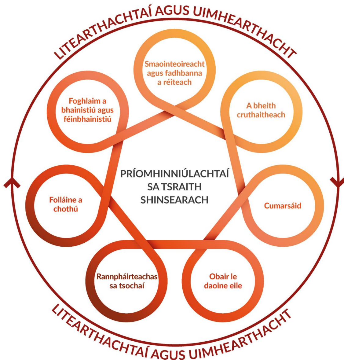
Fíor 2 Príomhinniúlachtaí sa tSraith Shinsearach, lena dtacaíonn litearthachtaí agus uimhearthacht.

Is gaol dhá bhealach, cómhálartach é an gaol idir príomhinniúlachtaí, litearthachtaí agus uimhearthacht. Tacaíonn forbairt litearthachta agus uimhearthachta le forbairt na n-inniúlachtaí agus a mhalairt. Tacaítear leis na príomhinniúlachtaí nuair: