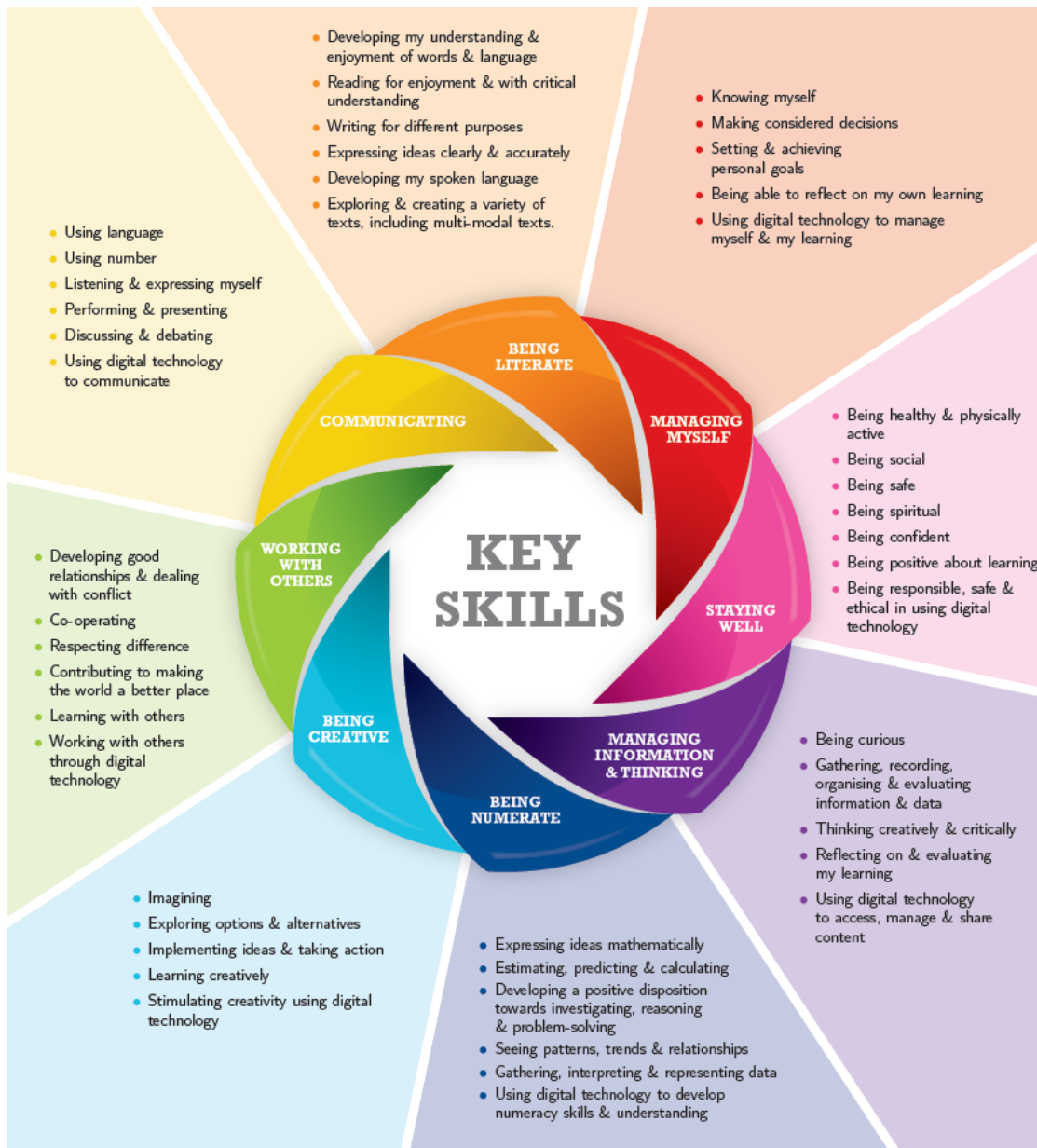
Fíor 1 Príomhscileanna na Sraithe Sóisearaí