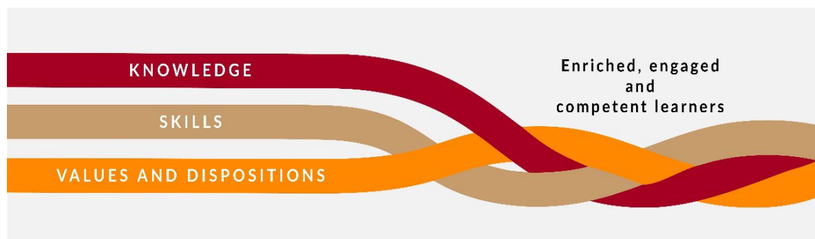
Fíor 1 Comhpháirteanna na n-inniúlachtaí agus an tionchar a mhianaítear leo

Cabhraíonn an tsraith shinsearach leis an scoláire a bheith níos rannpháirtí, níos saibhre agus níos inniúla, agus é ag déanamh tuilleadh forbartha ar a chuid eolais, scileanna, luachanna agus meonta ar bhealach comhtháite.