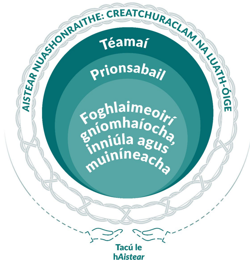
Fíor 2 Aistear: creatcúraclam na luath-óige.

Beidh Aistear fós ag feidhmiú mar chreatcúraclam seachas curaclam. Leagtar amach fíís shoiléir agus na prionsabail don teagasc agus don fhoghlaim i gcreat curaclaim. Tarraingítear aird ann ar a bhfuil tábhachtach agus déantar cur síos ann ar na rudaí ar cheart tús áite a thabhairt dóibh. Tá cur síos sna Téamaí ar uaimhianta maidir lena bhfoghlaiméoidh babaithe, naíonáin agus páistí óga. Is ráitis leathana ach infheicthe iad na Spriocanna Foghlama a thacaíonn le curaclam a fhorbairt a bheidh infheidhmithe in éagsúlacht de shuíomhanna agus leis na haoisghrúpaí éagsúla.