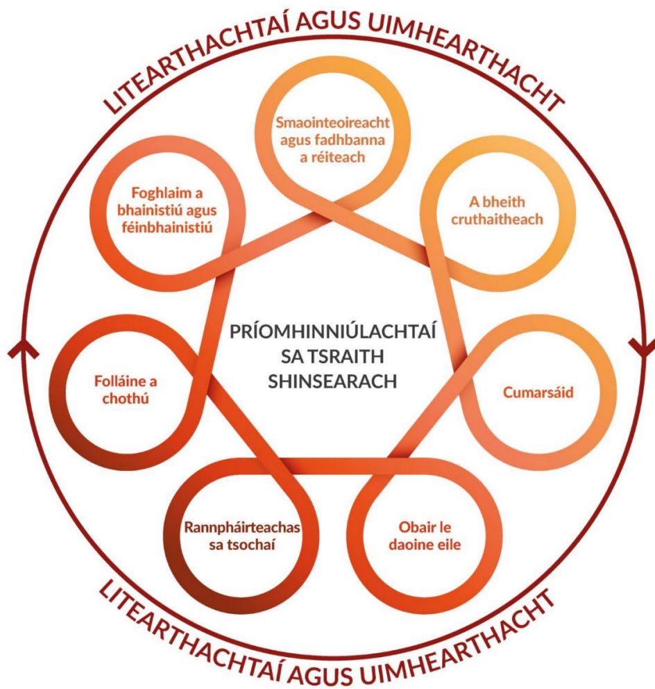
Fíor 2 Príomhinniúlachtaí sa tSraith Shinsearach, lena dtacaíonn litearthachtaí agus uimhearthacht.

Tá na scileanna seo nasctha le chéile agus is féidir iad a chónascadh; is féidir leo feabhas a chur ar fhoghlaim fhoriomlán an scoláire; is féidir leo cabhrú leis an scoláire agus leis an múinteoir naisc bhríocha a dhéanamh idir agus thar réimsí éagsúla foghlama; agus tá tábhacht ag baint leo tríd an gcuraclam go léir.