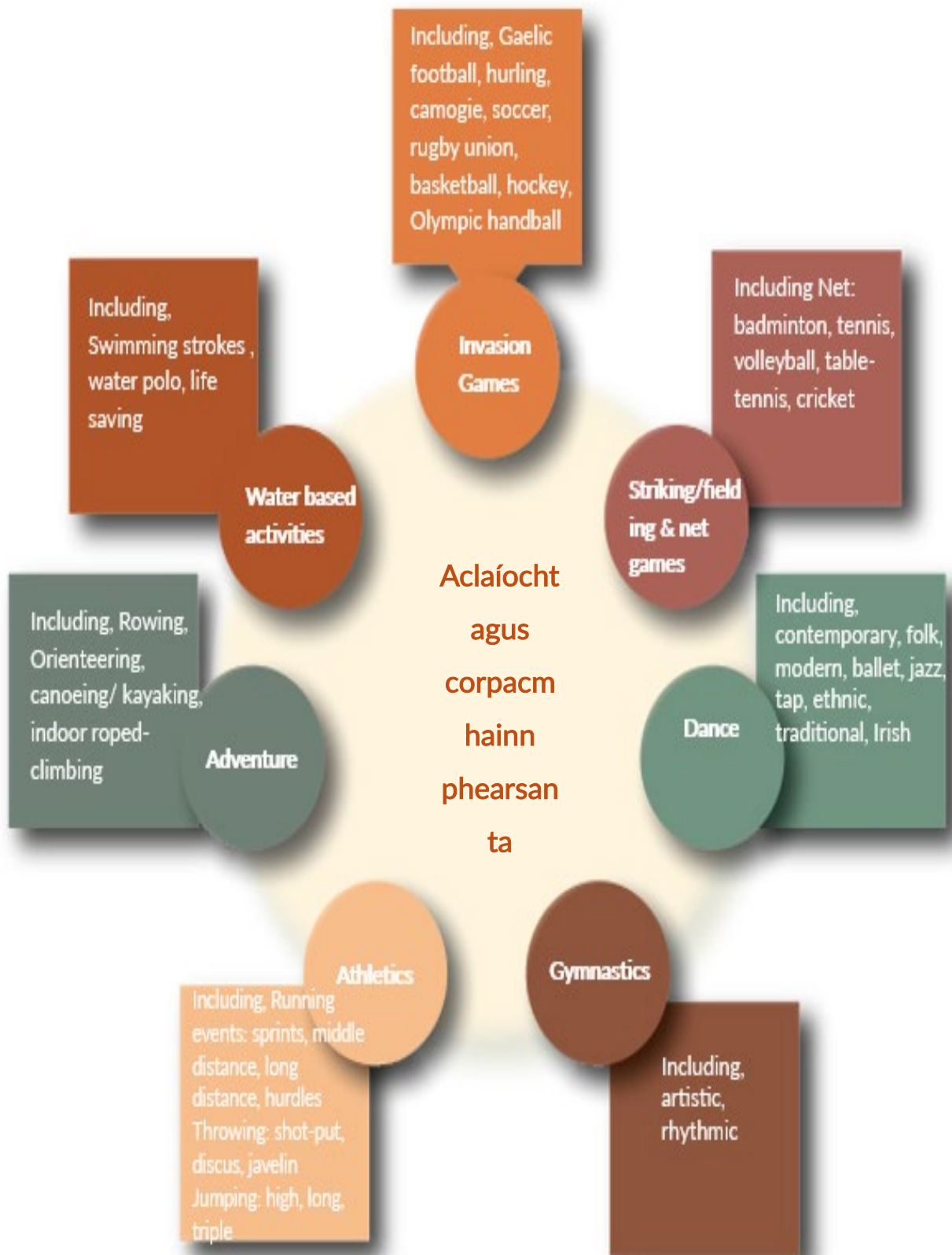
Fíor 4: na réimsí gníomhaíochta coirp