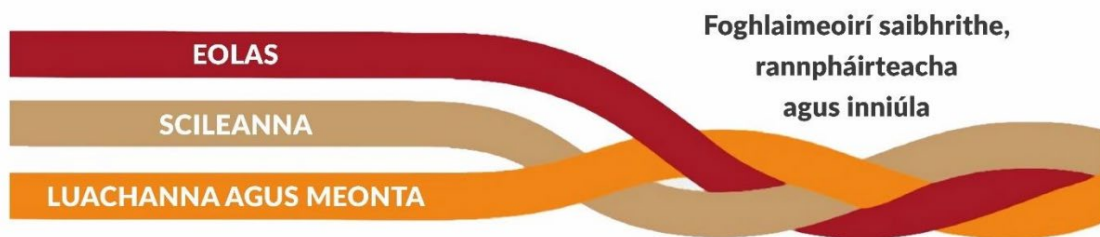
Fíor 1 Comhphárteanna na bpríomhinniúlachtaí agus an tionchar a mhianaítear leo

Is scáth-théarma é Príomhinniúlachtaí ina ndéantar tagairt don eolas, na scileanna, na luachanna agus na meonta a fhorbraíonn an scoláire ar bhealach comhtháite le linn na sraithe sinsearaí.