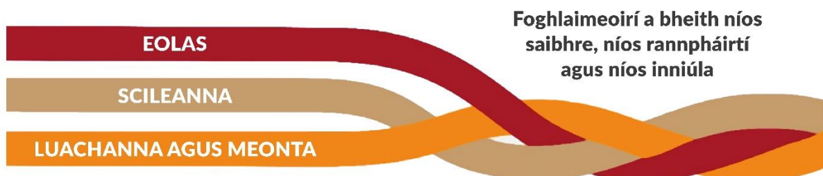
Fíor 1 Comhpháirteanna na bpríomhinniúlachtaí agus an tionchar a mianaítear leo

Is scáth-théarma é Príomhinniúlachtaí ina ndéantar tagairt don eolas, na scileanna, na luachanna agus na meonta a fhorbraíonn an scoláire ar bhealach imeasctha le linn na sraithe sinsearaí.